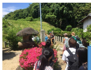
屋島から史跡の探索。たくさんさんのバディと一緒に