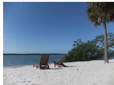
美しいビーチのあるキャンパスと、アクティブラーニングに基づく学び