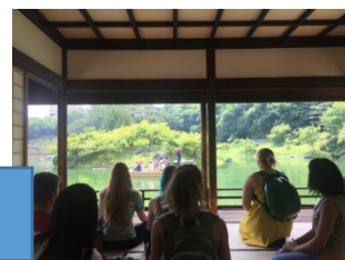
栗林公園掬月亭にて、日本の庭園の美に触れる