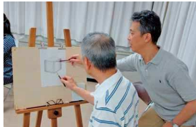
デッサン教室での一コマ