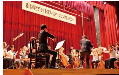
オープニングセレモニーの様子