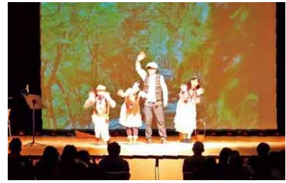
学生による演劇公演