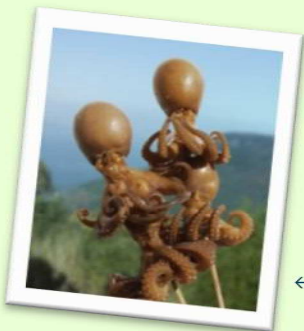
← 屋島名物 いいだこおでん

高松の夜景を觀に屋島へGO!、(・▽・)ノ 讃岐名物、いいだこおでんあり！たぬきあり？！ 天気も良ければ、瀬戸内海に沈む夕日も最高です。