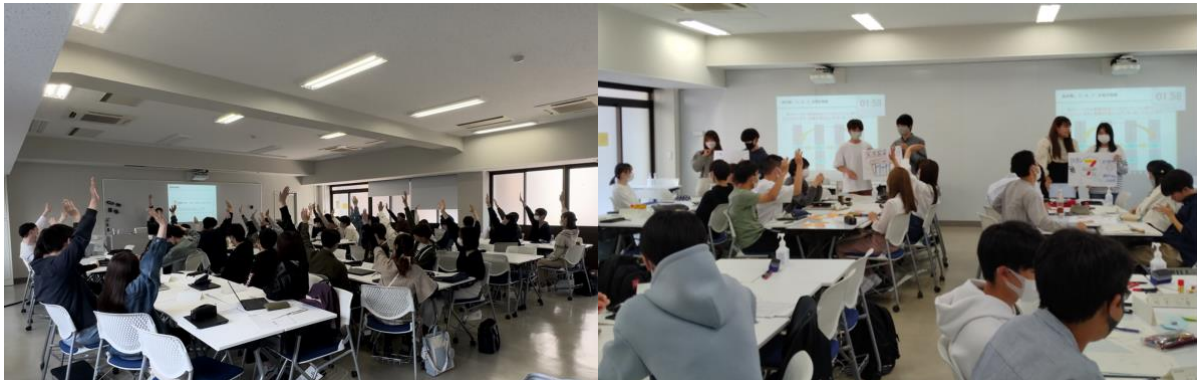
ロジカル思考演習の様子