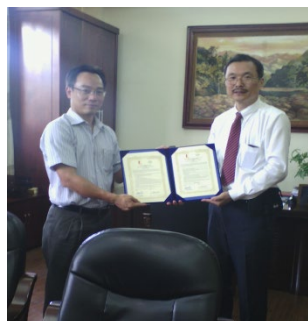
学長から協定書の受理