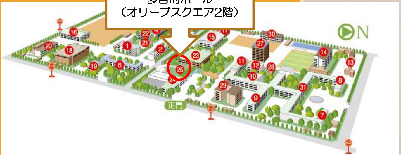
香川大学幸町キャンパスMAP