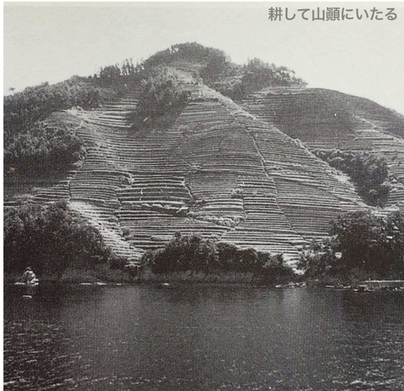
鹿島 (1959年8月30日撮影): 宮本常一『私の日本地図 第4巻 瀬戸内海 I 広島湾付近』未来社, 2014年, 178頁