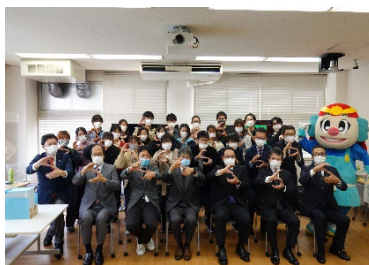
* SETOKU 結成時の写真