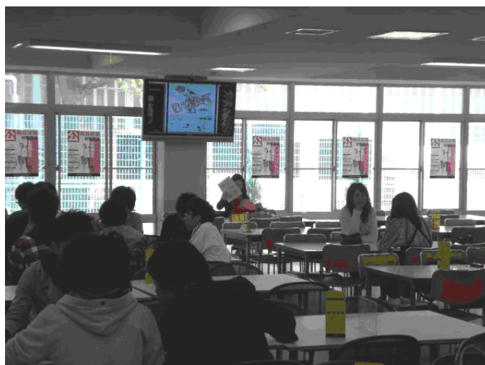
図1. Web 広報システムの設置例 幸町食堂

昨年、私たちは「学生の学生による Web 広報システム」と題して電子掲示板システムを作成しました。このシステムは、学生がインターネット上から画像を投稿することが可能で、サークルや行事の告知を行うことができるようになっています。現在幸町キャンパス、工学部キャンパス、農学部キャンパスの3カ所に大型モニターを設置しています。