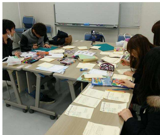
「おみやげBOOK」作成風景