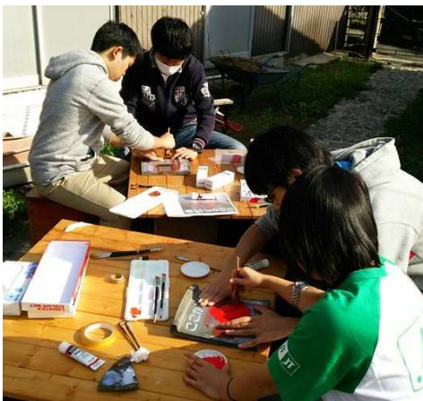
「瓦（ここから民家）」看板作成風景