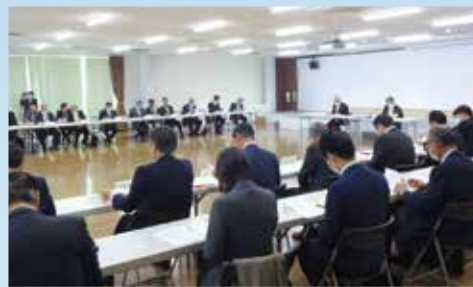
「大学・地域共創プラットフォーム香川」令和4年度第2回総会

取組を集約し、互いの強みを活かして、多角的な見地から議論を深めつつ課題解決に取り組む、まったく新しい共創の場です。特に、県内大学等地域全体にダイレクトにアプローチできる環境がユニークなところ。事務局を務める香川大は、産官学連携や学生たちの主体的な地域貢献活動が活発な風土を生かしつつ、地域に「人のかかわりをつくる・広げる」のが主な役割です。 設立1年目で各部会の取組はまだまだこれからです