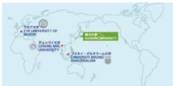
本学の海外教育研究拠点校

国際研究支援センターは、国際的な研究交流の支援及び大学としての国際化方針に基づく戦略の実施について中心的な役割を果たし、本学における国際的な学術交流の推進に寄与することを目的とし、(1)国際共同研究及び国際展開プロジェクトの企画・開発及び推進、(2)海外の研究機関との研究者交流の支援、(3)海外教育研究拠点校との学術交流の支援など幅広く担っています。