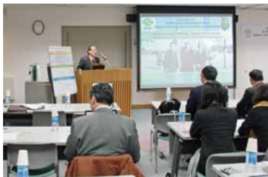
香川大学・チェンマイ大学合同シンポジウム