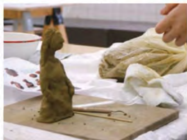
ワークショップの様子 (布下 翔基)