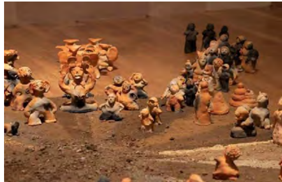
4 作品：布下翔基