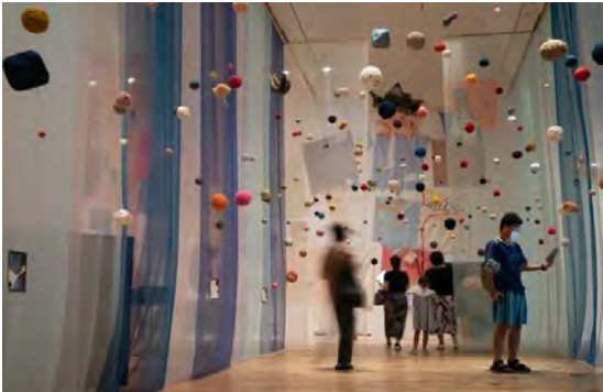
1 作品：五十嵐靖晃