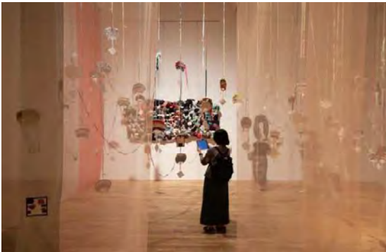
3 作品：そねまい