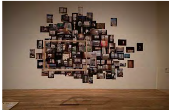
2 作品：岩田とも子