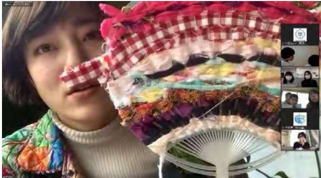
7 そねまい オンラインワークショップのようす