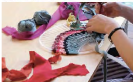
ワークショップの様子 (そねまい)