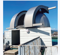
屋上に設置されている天体ドーム

理学博士。専門は天体物理学・天文教育。博士号を取得後、大阪市立科学館(学芸員補)を経て、1991年、香川大学に着任、2005年から現職。星間空間に漂う固体塵粒子の物理的な特性や、恒星が形成される星間雲についての研究を行いつつ、天文教育や天文学史についても研究をしている。