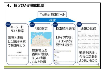
図4：Twitter 検索ツール（開発中）の概要