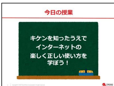
図2：小学校向けの教材例（一部）