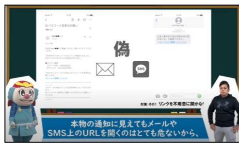
図3：サイバーセキュリティ強化月間の作成映像