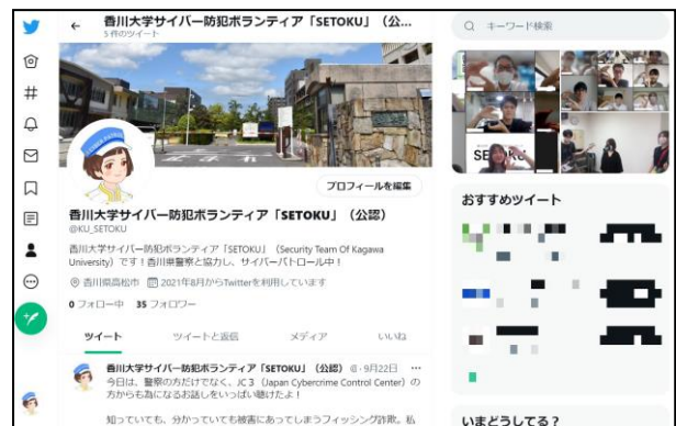
図1：SETOKU の公式アカウント