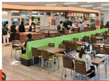
▲2Fには人気のベーカリーカフェ 空海(ソラミ)