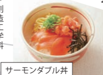
サーモンダブル丼